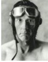
Freek de Jonge.